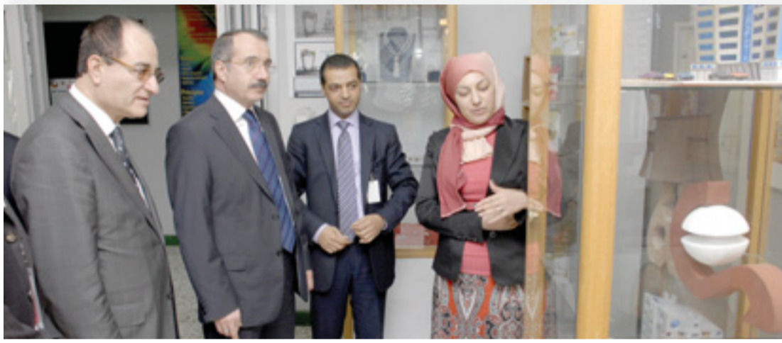
• وزير العمل التركي خلال جولته في المعهد

مدينة عيسى - معهد البحرين للتدريب: زار وزير العمل التركي عمر دينجر بزيارة لمعهد البحرين للتدريب. وكان بمرتبته خلال الزيارة السفير التركي في البحرين خلدون عثمان والرئيس التنفيذي لهيئة تنظيم سوق العمل علي أحمد رضي وعدد من مسؤولي السفارة التركية في المملكة.